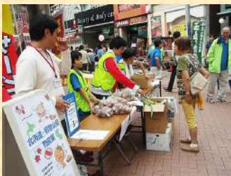
▲オズ・フェスタの様子