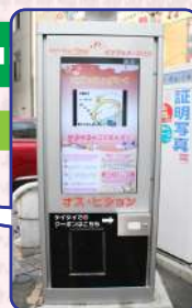
デジタルサイネージ設置場所