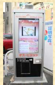
▲デジタルサイネージ