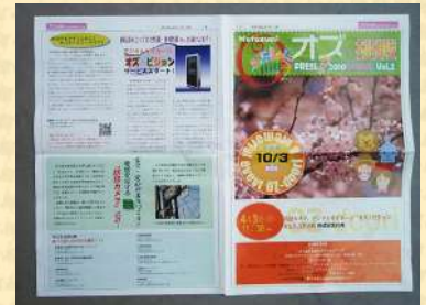
▲商店街発行の情報誌