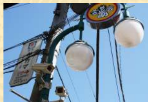
▲防犯カメラと街路灯